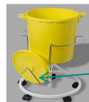
Stativ # 4716 med lågholder # 4719