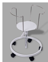
Stativ # 4716

Stativ # 4716 med hjul og lågholder # 4719.