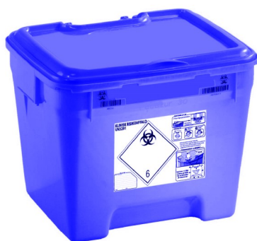
Affaldsbeholder 30 L, firkant, blå med låg