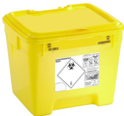
Affaldsbeholder, 30 L, gul med låg